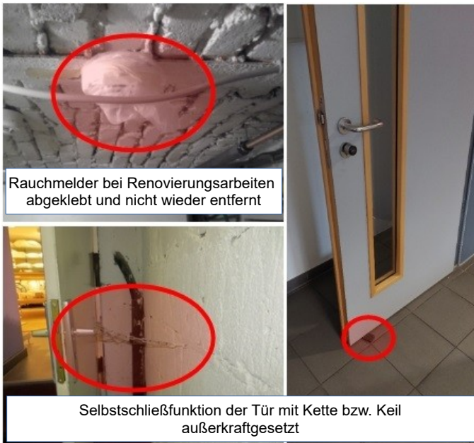
Abb. 1: Beispiele außerkraftgesetzter Einrichtungen

Leider kommt es immer wieder vor, dass zum Teil unwissentlich, brandschutztechnische Einrichtungen außer Kraft gesetzt oder entfernt werden.