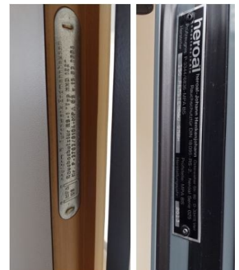
Abb. 2: Kennzeichnung von Türen

Oft bezieht sich die „Manipulation“ auf das Außerkraftsetzen der Selbstschließfunktion durch Unterkeilen oder Feststellen. Unachtsamkeit, aber auch Bequemlichkeit der Nutzer die Tür nicht ständig öffnen zu müssen sind häufige Gründe .